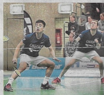
Deutsche Spitze: das Badmintonteam des TV Refrath.