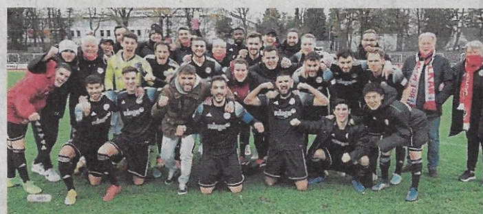
Die Spieler von Fußball-Regionalligist SV 09 Bergisch Gladbach jubeln nach ihrem Sieg gegen den Bonner SC.

Die Fußballer stehen am Ende der Hinserie in der Regionalliga West über dem Strich, also auf einem Nichtabstiegsplatz, haben sich im Vergleich zur Vorsaison deutlich gesteigert. Während des Lock-downs im Frühjahr hat die Mannschaft für Senioren Einkäufe übernommen und für Menschen in Altenheimen gesammelt.