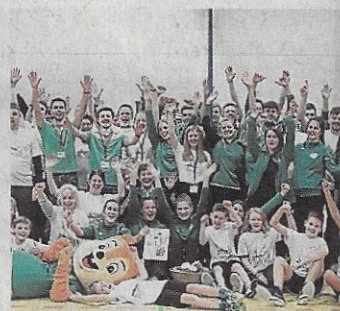
Korfbal-Jubel bei den Spielern des TuS Schildgen.