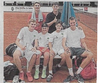
Junioren des Tennisclubs Grün-Gold Bensberg.