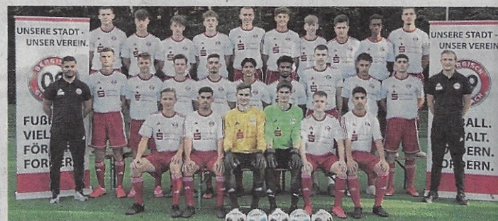
Die A-Jugend des SV Bergisch Gladbach 09 ist unbesiegter Tabellenführer der Bezirksliga, Staffel 1.

Die Basketballerinnen sind in der 2. Bundesliga Nord bisher einmal besiegt worden, aktuell Zweiter der Tabelle. Der Aufstieg in die 1. Liga ist erklärtes Ziel. Im DBB-Pokal siegten die Lions zum Auftakt in Neuss. Gegen den Tabellenführer aus der 1. Basketball-Bundesliga aus Kelttern gab es eine knappe Niederlage im Pokal.