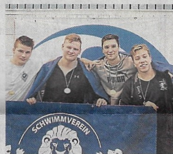
Das Team des Schwimmvereins Bergisch Gladbach.

Die Korfballerinnen und Korfballer belegten bei den – vom TuS Schildgen erstmals ausgerichteten – EuroShields den fünften Rang. Seit vielen Jahren spielt dieser Verein in der Sportart Korfbal eine herausragende Rolle, auch weit über die Region hinaus.