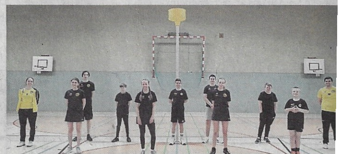
Im Korfbal erfolgreich ist die SG Pegasus Rommerscheid aus Bergisch Gladbach.